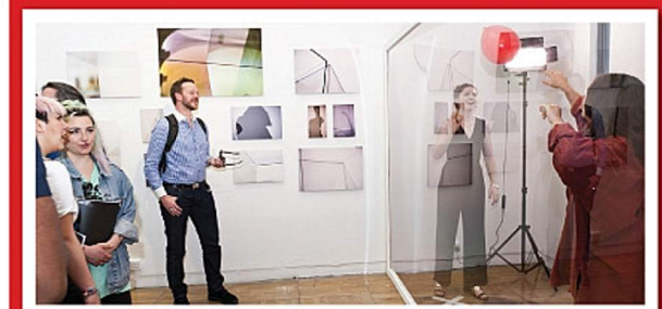
■ 媒體的使用已滲透於社會各個層面，由政論團體與非政府組織，以至商業機構都需要一些熟悉新媒體，具備批判思維，擁有創意的人才，讓他們協助制訂相關策略或參與推廣項目的工作。

兩個課程目的是培訓新一代的媒體專才，使學員能更精確地判斷文化發展及傳媒的最新趨勢，有助他們為企業制訂相關策略，策劃公關活動、品牌宣傳等。