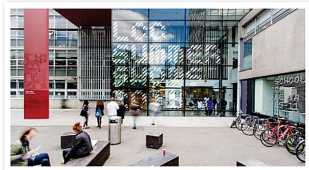
■ 英國百年學術倫敦藝術大學首度落戶香港，在英國以外開辦碩士課程。倫敦傳播學院 (LCC) 是倫敦藝術大學另一擁有逾百年歷史的學院，培育無數媒體傳意及設計專才。