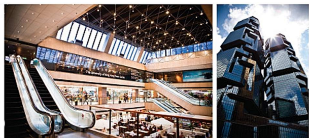
■ 學生主要在香港大學位於金鐘的市區中心上學，方便一般在職人士。

按香港大學學制， 經香港大學專業進修學院頒授 2016年2月開課 (為期7個月)